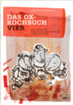
Das Ox-Kochbuch 4